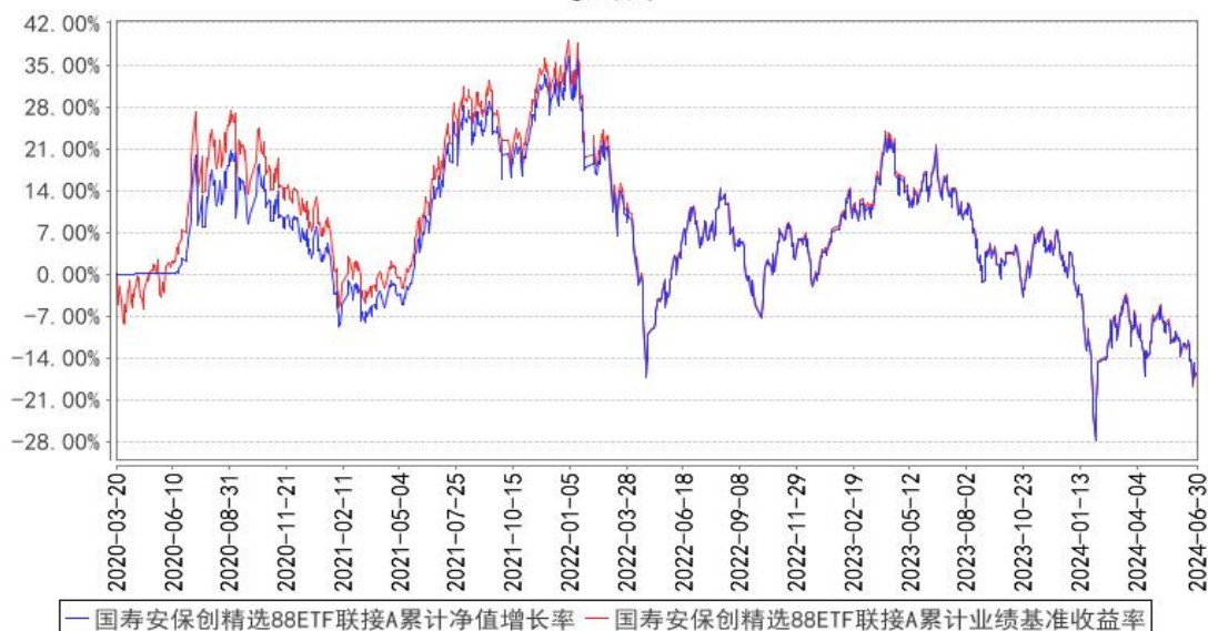
国寿安保创精选88ETF联接A累计净值增长率与同期业绩比较基准收益率的历史走势对比图