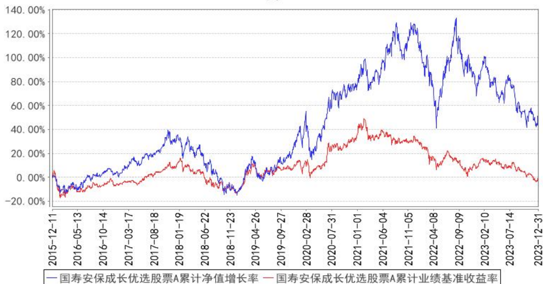
国寿安保成长优选股票A累计净值增长率与同期业绩比较基准收益率的历史走势对比图