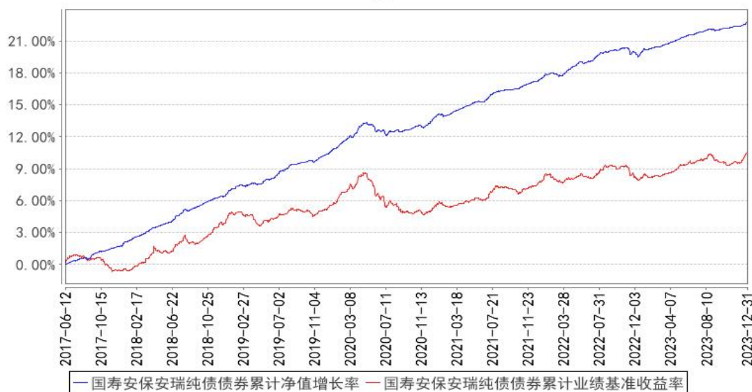
国寿安保安瑞纯债债券累计净值增长率与同期业绩比较基准收益率的历史走势对比图

注：本基金基金合同生效日为 2017 年 06 月 12 日，按照本基金的基金合同规定，自基金合同生效之日起 6 个月内使基金的投资组合比例符合基金合同关于投资范围和投资限制的有关约定。本基金建仓期结束时各项资产配置比例符合基金合同约定。图示日期为 2017 年 06 月 12 日至 2023 年 12 月 31 日。