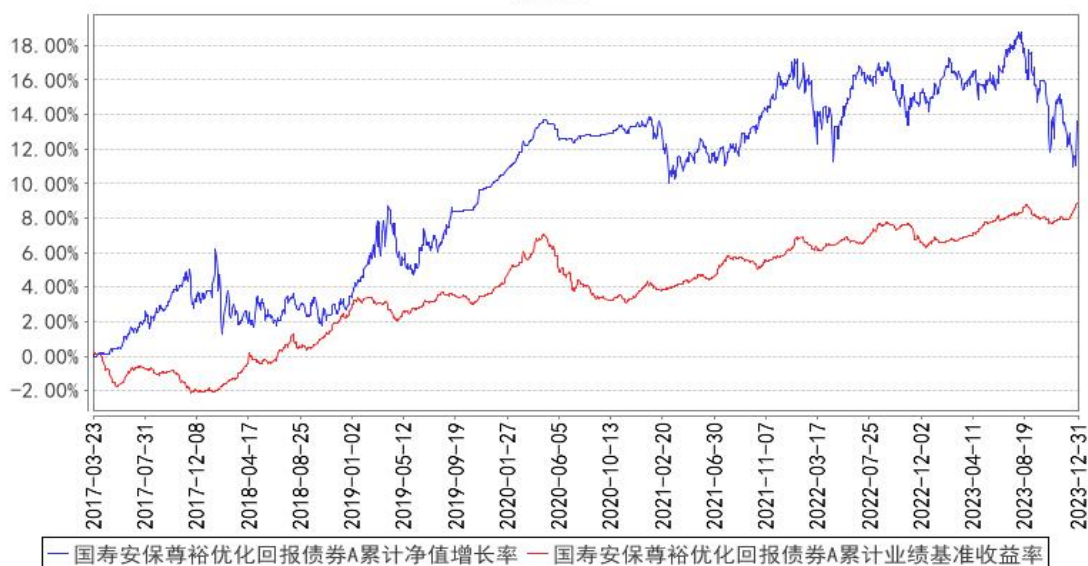
国寿安保尊裕优化回报债券A累计净值增长率与同期业绩比较基准收益率的历史走势对比图